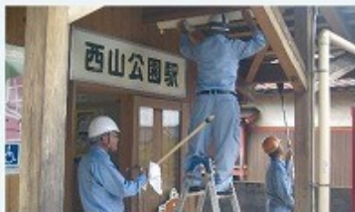
えちぜん鉄道(株)三国芦原線および勝山永平寺線の26無人駅 照明器具取り替えおよび駅舎内の清掃