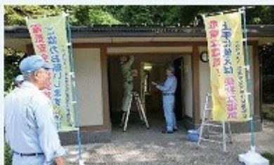
卯辰山公衆トイレ／電気設備点検、清掃