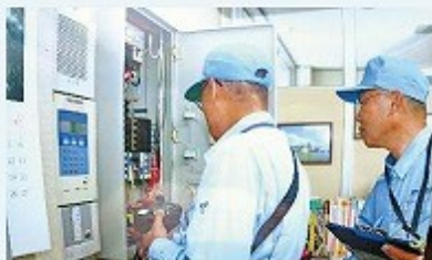
民族民芸村／電気設備点検 (民俗資料館・考古資料館・茶室円山庵)