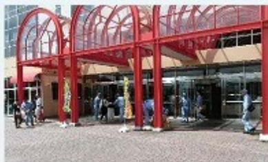
金沢地区街頭キャンペーン 安全パンフレット配布(アル・プラザ金沢)