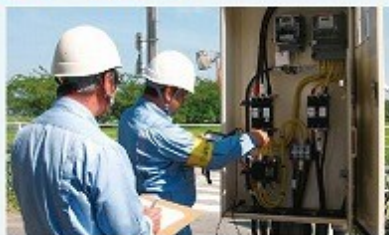
入善町営施設／電気設備点検 (サンビレッジ入善・米沢記念館・ 勤労者福祉センター・朽山いろり館)