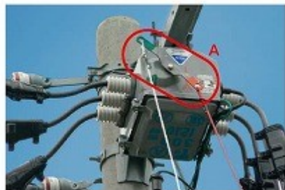
写真① ロープを直接取り付け